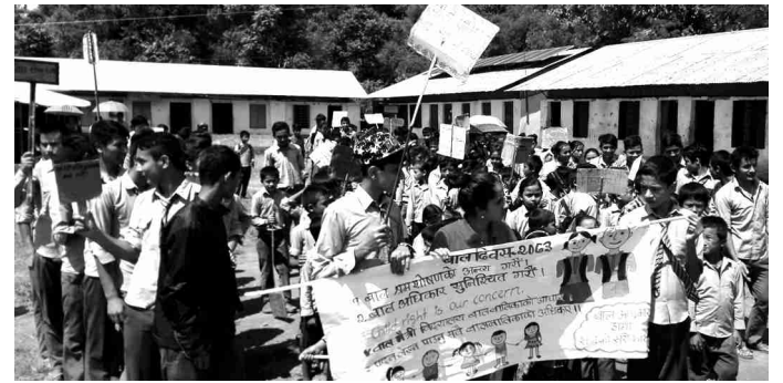
राष्ट्रिय बाल दिवस २०७३ विभिन्न कार्यक्रममा सहभागी भएका गिम्दी गाविसका बाल क्लवका सदस्यहरू

कार्यक्रममा ८६४ जना बालबालिकामा छात्रा ५ सय जना र छात्र २६४ जनाको सहभागिता रहेको थियो। विशेष गरी स्थानीयस्तरमा तीन गाविसमा छुट्टाछुट्टै कार्यक्रम गरी बाल दिवस २०७३ भएको थियो। कार्यक्रममा बालबालिकाले बालअधिकारको विषयमा गीत कविता तयार गरी प्रस्तुत गरेका थिए।