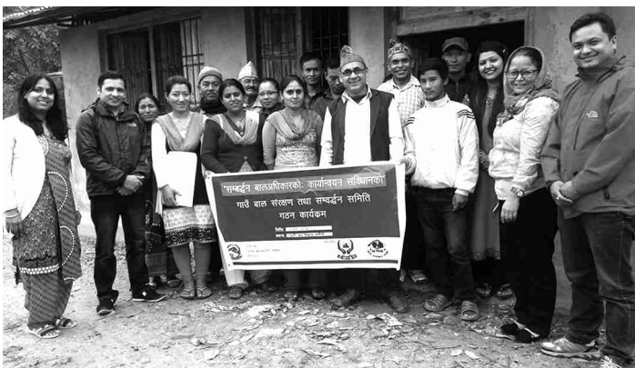
माल्टा गाविसमा बाल संरक्षण समिति गठन पश्चात सबै सहभागीहरु सामूहिक फोटो खिच्दै गरेको

बालबालिकाहरुको वास्तविक अवस्था पहिचान गर्न, आगामी दिनहरुमा उनीहरुको हितमा हुने गरी कार्यक्रमहरु सञ्चालन गर्न र सबै सहभागीहरुलाई बाल अधिकार र बाल संरक्षणका बारेमा सचेत गराउने उद्देश्यले समिति गठन गरिएको हो ।