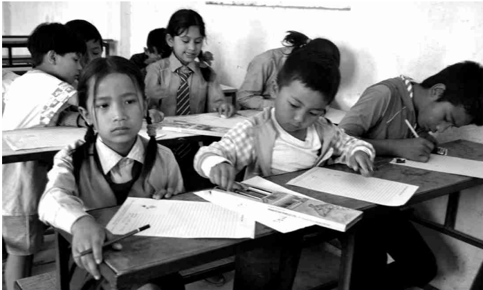
संस्थाबाट शैक्षिक सहायता कार्यक्रममा परेका विद्यार्थीहरुले आफ्ना सहयोगी दातालाई चिट्ठी लेख्दै

पत्रमार्फत आफ्नो भावनापोख्न पाउँदा विद्यार्थी बालबालिकाहरु धेरै खुसी भएका थिए । उनीहरुले आफ्नो हालको पारिवारिक अवस्था, पढाइ र भूकम्पपछिको अवस्थाका बारेमा समेत आफ्ना सहयोगी दातालाई जानकारी दिने उद्देश्यका साथ शुभकामना कार्डमा उल्लेख गरेका थिए ।