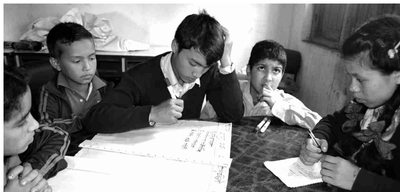
बाल सुरक्षा लेखाजोखा कार्यक्रममा आफ्नो सुरक्षाको मापन कसरी गर्ने भन्ने विषयक छलफल गर्दै गरेका बालबालिका

ललितपुर, सबै खाले जोखिम तथा प्रकोपबाट बालबालिका संरक्षित हुन पाउनु बालबालिकाको मौलिक अधिकार हो । अतः बालबालिकाको दृष्टिबाट आफ्नो घर, विद्यालय तथा समुदायमा बालसुरक्षाका समस्या र त्यस्ता किसिमका समस्याबाट कसरी सुरक्षित हुन सक्छौं भन्ने अभिप्रायले स्वयम् बालबालिकाको सहभागितामा लेखाजोखा गोष्ठी साउन र भदौ महिनाभित्र भएको थियो । ललितपुरका दक्षिण भेगका ६ गाविस क्रमशः ठूलादुर्लुङ, कालेश्वर, चौघरे, गिम्दी, प्युटार र माल्टाका ६ सामुदायिक विद्यालयका ७१ छात्र र ४८ छात्रा गरी जम्मा १३९ जना सहभागितामा बाल सुरक्षा लेखाजोखा कार्यक्रम सञ्चालन भएको थियो ।