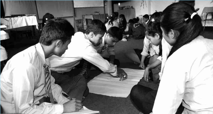
गिम्दी, आश्राङ, र तुलादुर्लुङका बाल क्लबका सदस्यहरू जीवन उपयोगी सीप तालिममा समूहगत कार्य गर्दै

सहभागी सबै बालबालिकाहरूले आफूले सिकेका कुराहरू अन्य बालबालिकाहरूसँग सिकाइ आदानप्रदान गर्ने र आफ्नो जीवनमा पनि सही तरिकाले यस तालिमको प्रयोग गर्ने प्रतिबद्धता सहित कार्यक्रम समापन भएको थियो।