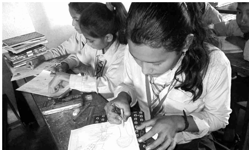
बाल केन्द्रित विपद् जोखिम न्युनिकरण विषयक चित्रकला प्रतियोगितामा प्रतिभा प्रस्तुत गर्दै गरेका बालबालिका

ललितपुर, ०७३ साल भदौ २९ गतेको राष्ट्रिय बालदिवसलाई लक्षित गरेर दक्षिण ललितपुरको गिम्दी, प्युटार, आश्राड, चौघरे, माल्टा, कालेश्वर र ठूलादुर्लुङ गाविसका विद्यालयहरुमा चित्रकला प्रतियोगिता गरियो । यस प्रतियोगितामा माध्यमिक र निम्न माध्यमिक तहका गरी जम्मा १० ओटा विद्यालयका बालबालिकाहरु सहभागी भए । प्रतियोगितामा छात्र ९४ र छात्रा ८३ गरी जम्मा १७७ ले सहभागिता जनाए ।