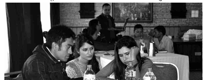
संस्थाको अर्धवार्षिक समीक्षा कार्यक्रममा सामूहिक योजना बनाउन छलफल गर्दै गरेको कर्मचारीहरू।