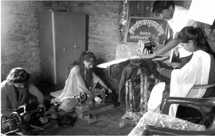
डडेल्धुरा, अजयमेरुका किशोरकिशोरिहरू सीप विकास मूलक कार्यक्रम तालिमका दौरान अभ्यास गर्दै।

यो कार्यक्रमको प्रभावकारीताका कारण आगामी दिनमा स्थानीय गाविसहरूले पनि यस्ता आयमूलक कार्यक्रम ल्याई गाउँका बेरोजगार युवालाई रोजगारतर्फ उन्मुख बनाउने रणनीति बनाउने धारणासहित तालिमको अन्तिम दिनलाई समापन गरिएको थियो।