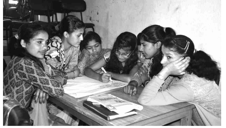
युथ किट्स एसेसमेन्ट कार्यक्रममा सामूहिक छलफल गर्दै गरेका किशोरकिशोरीहरू

ललितपुर, साउन र भदौ महिनामा दक्षिण ललितपुरको कालेश्वर, गिम्दी र चौघरेमा भूकम्पपछि किशोरावस्थामा आई पर्ने आपत्कालीन समस्यालाई पूर्व तयारी अवस्थामा कसरी रहने र आफ्नो शिक्षालाई पनि विना अवरोधका साथ निरन्तर अगाडी बढाउन सघाउ पुग्नेसाथै युथ किट्स निर्माण गर्ने उद्देश्यका साथ युथ किट्स एसेसमेन्ट (YOUTH KITS ASSESSMENT) कार्यक्रम भएको थियो। साथै भूकम्पपछि किशोरावस्थामा मनोसामाजिक रूपमा असर परेको कुरालाई मध्यजनर गर्दै ग्रामीण भेगका बालबालिकाहरूको अवस्थालाई सुधार गर्नका लागि सघाउ पुग्नेसमेत अपेक्षा रहेको थियो। यस कार्यक्रमबाट बालबालिकाले जोमिख, प्रकोप र विपत्को अवस्थामा युवाहरूको भूमिकाका विषयमा जानकारी पाएका थिए। जोखिम न्युनीकरण गर्न तयारी अवस्थामा बस्नका लागि आवश्यक सामग्रीहरूको पहिचान भई सोका बारेमा प्रशिक्षित भई सचेत हुन सक्षम भएका थिए। यस कार्यक्रममा ४३ बालक र ४३ बालिका गरी जम्मा ८६ जना सहभागी भएका थिए।