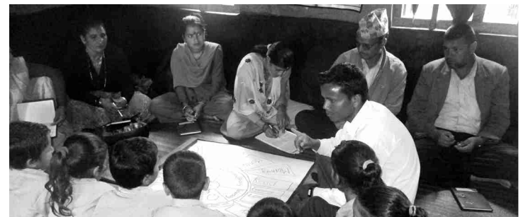
घुम्ती बैठकमा ल्याउने गरेको शैक्षिक कोसेलीको अभ्यास विधिद्वारा प्रत्यक्ष रूपमा विद्यार्थीहरूलाई सहभागी गरेर प्रदर्शन गर्दै डडेल्धुराका शिक्षक

लू निभा: बाल सरोकार समूहको आर्थिक सहयोगमा अजयमेरु र बडाल स्रोतकेन्द्रको सहजीकरणमा ३ ओटा घुम्ती बैठक सम्पन्न भयो। मिति २०७३ असार २८ गते अजयमेरु स्रोतकेन्द्रको कैलपाल प्राविमा गणित, मिति २०७३ असार ६ गते दरपुर निमाविमा अंग्रेजी र मिति २०७३ असोज १० गतेका दिन लाटा गन्याप प्राविमा अंग्रेजी विषयको घुम्ती बैठक सम्पन्न भएको थियो। उक्त कार्यक्रममा शिक्षक शिक्षिका गरी २० जना महिला र ३२ जना पुरुषको सहभागितामा भएको थियो। बैठकमा घुम्ती बैठकको महत्व र यसको आवश्यकताबारे अभिमुखीकरण गरियो। बैठकका सहभागीहरूले सम्बन्धित विद्यालयका गणित, अङ्ग्रेजी विषयका शिक्षकहरूले कक्षा शिक्षण गर्न सघाउ पुऱ्याउनुका लागि कोसेली लिई सम्बन्धित विद्यालयमा शैक्षिक सामग्रीका लागि योगदान दिनुका साथै स्कूलमा अवलोकन समेत गर्नु भएको थियो। उक्त कार्यक्रमका दौरानमा कक्षा शिक्षण गर्दा देखिएका समस्यालाई समाधानका लागि विभिन्न विद्यालयबाट आउने शिक्षकहरू र स्रोतव्यक्तिले आफ्ना अनुभवलाई एक आपसमा आदानप्रदान गरी कक्षा शिक्षण विधिमा सुधार गर्न सल्लाह लिनेदिने गरी कार्यक्रम भएको थियो। २४ विद्यालयका विषय शिक्षकको सहभागितामा गणित, अङ्ग्रेजी विषयमा देखिएका समस्याका बारेमा विस्तृत छलफल चलाउनु भएको थियो। बालबालिकाले सजिलैसँग बुझ्न नसक्ने, अङ्ग्रेजी शब्द लेख्न, बोल्न, चिन्न र गणितमा भागको समस्या र जोड घटाउका समस्यालाई स्रोतव्यक्तिले समाधानका उपायहरू देखाउनु भएको थियो।