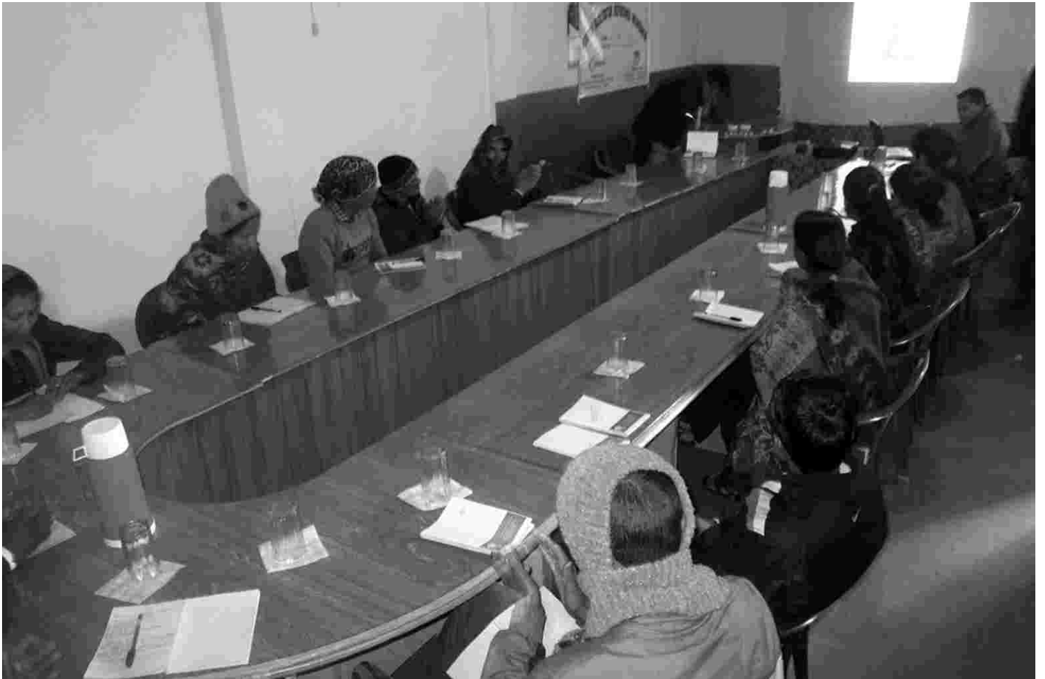
कार्यक्रममा परिचय दिँदै सहभागी युवा स्वयंसेवकहरू

सामुदायिक सचेतना कार्यक्रमलाई प्रभावकारी तथा दिगो रूपमा अगाडि बढाउनका लागि कार्यक्रम अवधिभर विभिन्न छलफल तथा अन्तर्क्रिया गरिएको थियो। विगतका अनुभवको आधारमा सहभागीहरूले सामाजिक कुप्रथालाई न्युनीकरण गर्ने उद्देश्यका साथ कार्यतालिका निर्माण गरेका थिए।