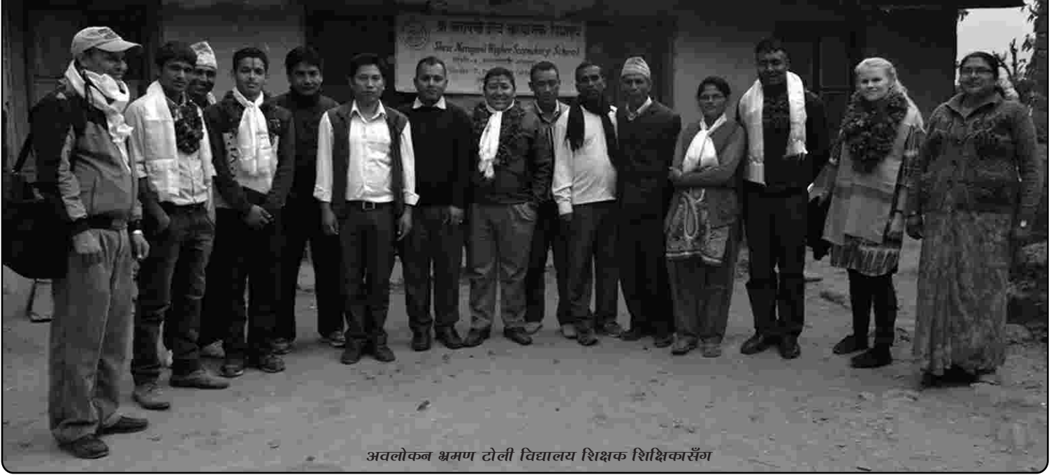
अवलोकन भ्रमण टोली विद्यालय शिक्षक शिक्षिकासँग

हासिल गरेका उपलब्धि तथा चुनौतीहरूका बारे जानकारी लिने उद्देश्यका साथ स्थलगत अवलोकन भ्रमण तय गरिएको थियो। सोहीअनुरूप गिम्दी गाविसकोश्री जनक मावि, नारायणी उमावि र आश्राङको विद्याधिश्वरी उमाविका शिक्षक र विद्यार्थीहरूसँग अन्तर्क्रिया गरेका थिए। सो कार्यक्रममा सम्बन्धित गाविसका समाजिक परिचालकहरूले सहयोग गरेका थिए।