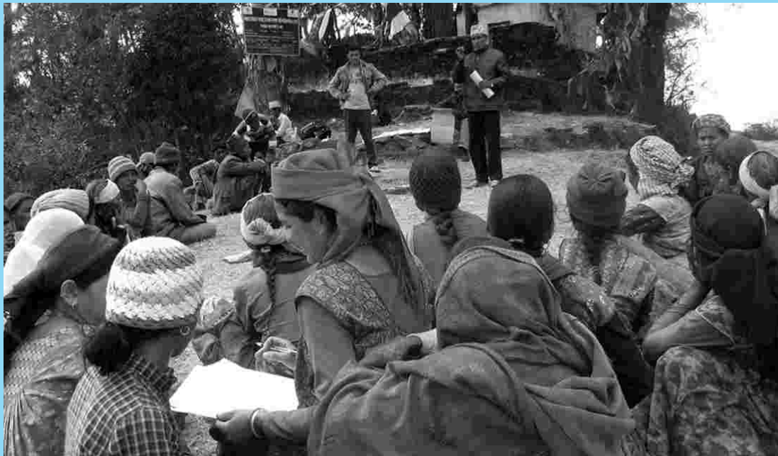
कार्यक्रममा सहभागी अभिभावकहरू तथा कार्यक्रम शुरुवात गर्दै युवा स्वयंसेवकहरू

बालक्लवका सदस्यहरूले क्लवमा आवद्ध भएर आफैले कार्ययोजना निर्माण गरी व्यवस्थित रूपमा सञ्चालन गर्न सकेको, बोल्ने सीपमा विकास भएकोमा खुसी व्यक्त गर्नुभयो। बालक्लवमा सबै विद्यार्थीहरूको सहभागी गराउन नसकेको र बालविवाहका मुद्दामा केही कार्यक्रम गर्न नसकेको कम्जोरीका रूपमा बालक्लवहरूले प्रस्तुत गरेका थिए।