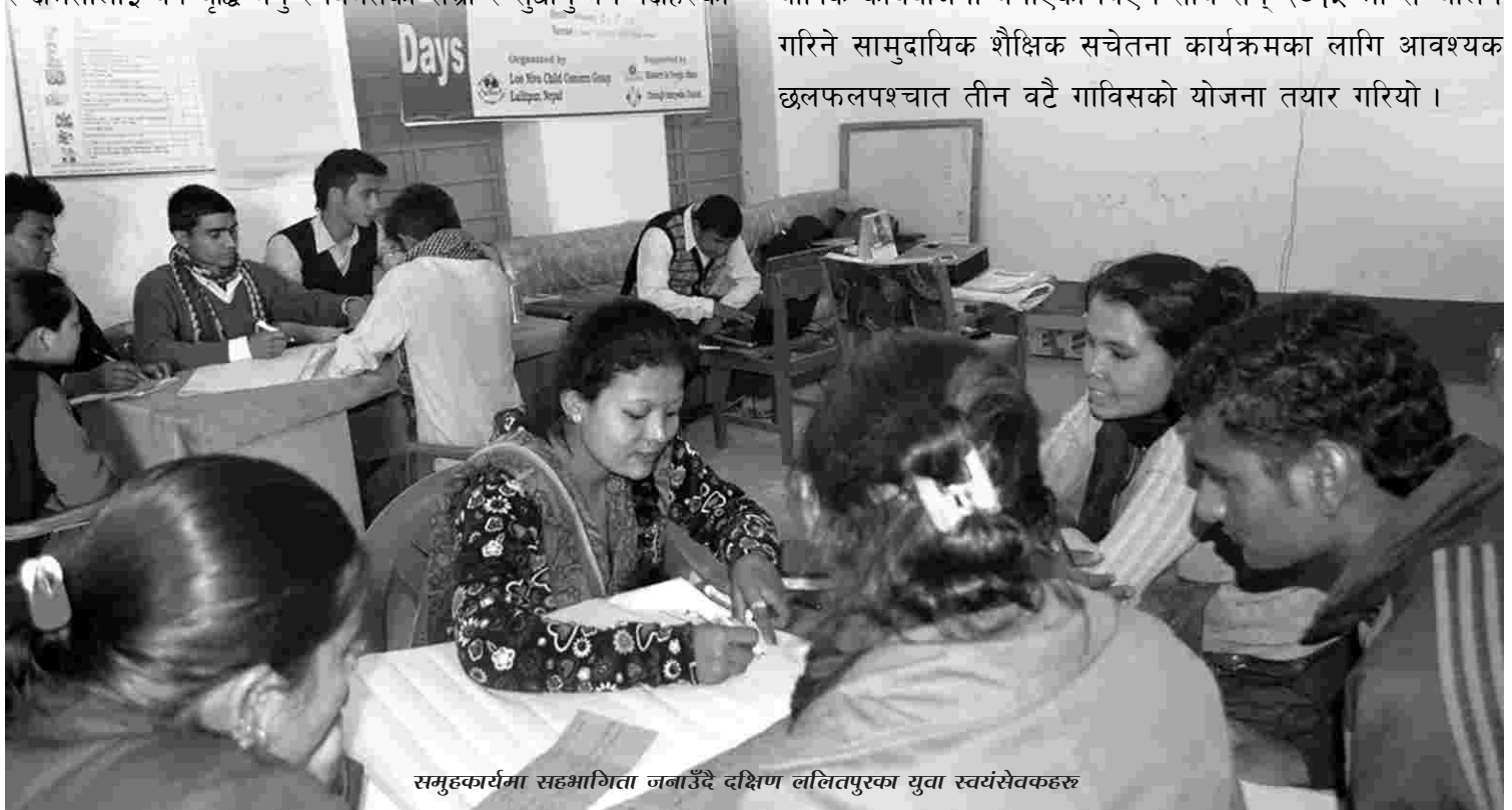
समुहकार्यमा सहभागिता जनाउँदै दक्षिण ललितपुरका युवा स्वयम्सेवकहरू

कार्यक्रममा तीन वटै गाविसका युवा स्वयम्सेवकहरूको सक्रिय सहभागितामा दक्षिण ललितपुर युवा सञ्जाल गठन भई वार्षिक कार्ययोजना बनाएका थिए। साथै सन् २०१५ मा सञ्चालन गरिने सामुदायिक शैक्षिक सचेतना कार्यक्रमका लागि आवश्यक छलफलपश्चात तीन वटै गाविसको योजना तयार गरियो।