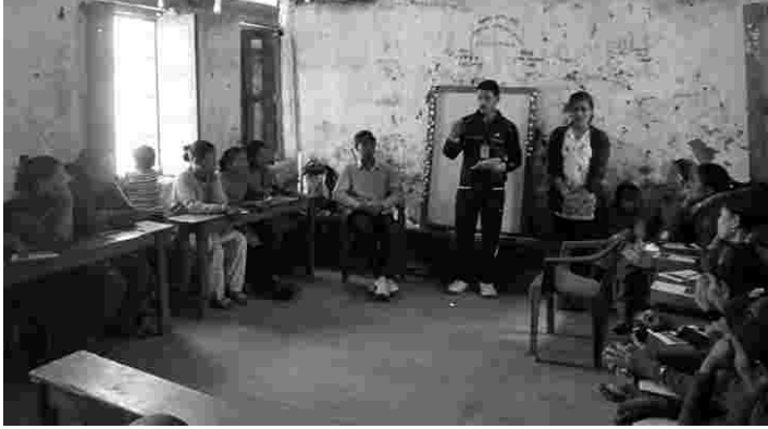
सचेतना कार्यक्रममा सहजिकरण गर्दै सामाजिक परिचालक (दायाँ) युवा स्वयंसेवक (बायाँ)

सहभागी अभिभावकहरूले आफ्ना बालबालिकाहरूलाई विद्यालयमा भर्ना गरिदिने पश्चात आफ्नो सम्पूर्ण जिम्मेवारी सकेको ठान्ने सोचप्रति गलत भएको बताएका थिए। गुणस्तरीय शिक्षा प्रवर्द्धनमा अभिभावकको भूमिका विषय महत्वपूर्ण भएकाले अबका दिनमा यसमा चिन्तनशील भई लाग्ने र नियमित रूपमा सम्बन्धित विद्यालय व्यवस्थापन समिति तथा शिक्षकहरूसँग भेटघाट गरी छलफल गर्ने पनि बताए। आफ्ना गाविसमा बालविवाह पनि एक समस्या र विकृतिकै रूपमा रहेकाले आगामी दिनहरूमा यसलाई रोकथाम गर्न टोलटोलमा अभियान चलाउने पनि निर्णय गरियो।